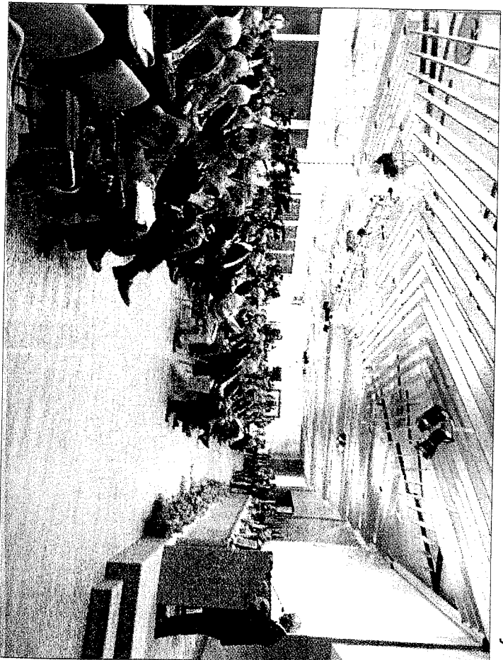
Pogled na udeležence zasedanja na tržški pomorski postaji

Zaključno zasedanje spremljala poulična demonstracija proti »nezvdržnemu razvoju«